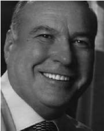
Stojan Andov, pol i ti -ar i